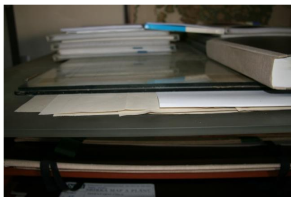
lisování v kopírovacím rámu